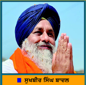
■ ਸੁਖਬੀਰ ਸਿੰਘ ਬਾਦਲ

ਸਿੱਧ ਬਾਦਲ ਦੇ ਹੱਕ ਵਿੱਚ ਨਾਹਰੇਬਾਜ਼ੀ ਕਰਨ ਦੀਆਂ ਵੀ ਰਿਪੋਰਟਾਂ ਮਿਲੀਆਂ ਹਨ। ਅਕਾਲੀ ਦਲ ਦੇ ਆਈ.ਟੀ. ਸੈਲ ਵੱਲੋਂ ਸੋਸ਼ਲ ਮੀਡੀਆ 'ਤੇ ਵੀ ਸੁਖਬੀਰ ਬਾਦਲ ਦੇ ਹੱਕ ਵਿੱਚ ਇੱਕ ਵੱਡੀ ਮੁਹਿੰਮ ਚਲਾਈ ਗਈ। ਉਪਰੋਕਤ ਨੌਜਵਾਨ ਆਗੂਆਂ ਨੇ ਸੁਖਬੀਰ ਸਿੰਘ ਬਾਦਲ ਦਾ ਅਸਤੀਫਾ ਅਪ੍ਰਵਾਨ ਕਰਨ ਲਈ ਜੋਰ ਪਾਇਆ। ਇਨ੍ਹਾਂ ਦਾ ਆਖਣਾ ਸੀ ਕਿ ਜੇ ਅਜਿਹਾ ਨਾ ਕੀਤਾ ਗਿਆ ਤਾਂ ਉਹ ਵੀ ਨਾਲ ਹੀ ਅਸਤੀਫੇ ਦੇ ਦੇਣਗੇ।