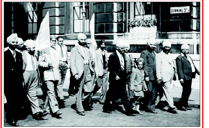
8 ਅਗਸਤ 1947 ਨੂੰ ਡਾਉਨਿੰਗ ਸਟਰੀਟ, ਲੰਡਨ ਤੋਂ ਰਵਾਨਾ ਹੋਏ ਸਿੱਖਾਂ ਦਾ ਇੱਕ ਵਡਦ, ਜਿਸ ਨੇ ਇੱਕ ਪਟੀਸ਼ਨ ਪੇਸ਼ ਕੀਤੀ ਸੀ ਜਿਸ ਵਿੱਚ ਬ੍ਰਿਟਿਸ਼ ਭਾਰਤ ਦੀ ਵੰਡ ਵੇਲੇ ਪੂਰੇ ਪੰਜਾਬ ਖੇਤਰ ਨੂੰ ਭਾਰਤ ਰਾਜ ਵਿੱਚ ਸ਼ਾਮਲ ਕਰਨ ਦੀ ਮੰਗ ਕੀਤੀ ਗਈ ਸੀ।

ਨਿੱਘ ਮਿਲਣ ਵਿੱਚ ਕੋਈ ਇਤਰਾਜ਼ ਨਹੀਂ ਹੋਵੇਗਾ। ਦੂਜੇ ਪਾਸੇ ਜਦੋਂ ਮਹਾਤਮਾ ਗਾਂਧੀ ਨੇ ਮਿਸਟਰ ਜਿਨਾਹ ਨੂੰ ਪਾਕਿਸਤਾਨ ਬਣਨ ਤੋਂ ਰੋਕਣ ਖਾਤਰ ਆਪਣੀ ਚਤੁਰਾਈ ਵਰਤਣੀ ਚਾਹੀ ਤਾਂ ਜਿਨਾਹ ਨੇ ਗਾਂਧੀ ਦੀ ਚਤੁਰਾਈ ਵਾਲੇ ਲਫਜ਼ ਹਾਰ 'ਚ ਹੀ ਬੁੱਝ ਲਏ। ਗਾਂਧੀ ਨੇ ਜਿਨਾਹ ਨੂੰ ਆਖਿਆ ਕਿ ਤੂੰ ਇੱਕ ਚੁਆਨੀ ਜਿੰਨਾ ਪਾਕਿਸਤਾਨ ਲੈ ਰਿਹਾ, ਤੂੰ ਹਿੰਦੁਸਤਾਨ ਰਹਿ ਅਸੀਂ ਤੈਨੂੰ ਇਹਦੇ 'ਚ ਅਠਿਆਨੀ ਜਿੰਨਾ ਹਿੰਦੋਦਾਰ ਬਣਾਵਾਂਗੇ। ਜਿਨਾਹ ਬਿਨਾਂ ਸੋਚੇ ਬੋਲਿਆ, "ਉਹ ਗਾਂਧੀ ਤੂੰ ਮੇਰੀ ਜਦੋਂ ਚੁਆਨੀ ਨੂੰ ਜਰਦਾ ਤਾਂ ਤੂੰ ਮੈਨੂੰ ਅਠਿਆਨੀ ਕਿੱਥੋਂ ਦੇ ਦੇਵੇਗਾ! ਜੇ ਦੇਵੇਗਾ ਤਾਂ ਅਠਿਆਨੀ