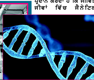
ਜਾਣਕਾਰੀ ਕਿਵੇਂ ਪ੍ਰਗਟ ਕੀਤੀ ਜਾਂਦੀ ਹੈ।

3. ਡਾ. ਖੋਰਾਣਾ ਨੇ ਪਹਿਲੇ ਸਨਥੈਟਿਕ ਜੀਨ ਅਤੇ ਨਿਊਕਲਿਕ ਐਸਿਡ ਦਾ ਸੰਸਲੇਸ਼ਣ ਕੀਤਾ। ਉਨ੍ਹਾਂ ਨੇ ਅਜਿਹੀਆਂ ਤਕਨੀਕਾਂ ਵਿਕਸਿਤ ਕੀਤੀਆਂ, ਜਿਨ੍ਹਾਂ ਦੁਆਰਾ ਵਿਗਿਆਨੀ ਡੀ.ਐਨ.ਏ. ਦੇ ਖਾਸ ਕ੍ਰਮ ਦਾ ਨਿਰਮਾਣ ਕਰ ਸਕਦੇ ਹਨ। ਇਹ ਇੱਕ ਬਹੁਤ ਵੱਡੀ ਸਫਲਤਾ ਸੀ,