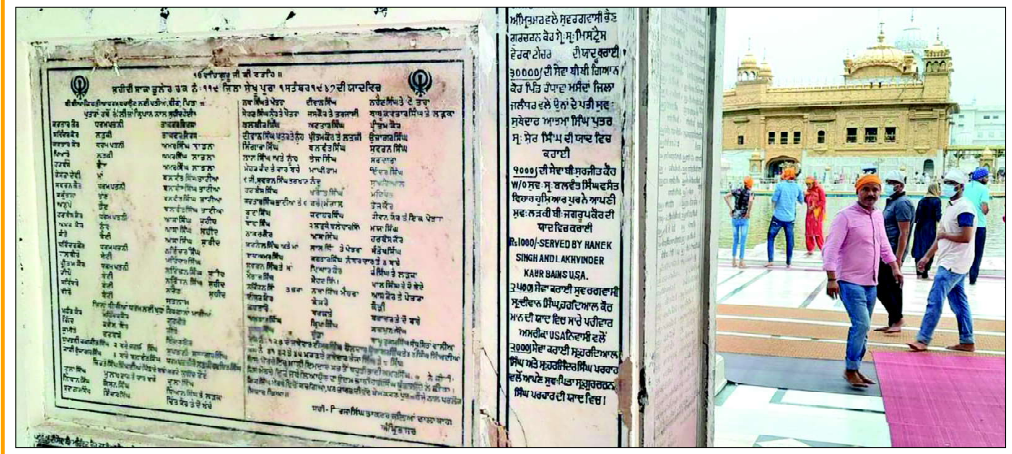
■ ਸ੍ਰੀ ਹਰਿਮੰਦਰ ਸਾਹਿਬ ਦੇ ਘੰਟਾ ਘਰ ਵਾਲੇ ਪ੍ਰਵੇਸ਼ ਦੁਵਾਰ 'ਤੇ 'ਸਾਕਾ ਭੁਲੇਰ' ਦੇ ਸ਼ਹੀਦਾਂ ਦੇ ਉਕਰੇ ਹੋਏ ਨਾਂਵਾਂ ਵਾਲੀ ਸਿੱਲ

14 ਅਗਸਤ 1947 ਨੂੰ ਪਾਕਿਸਤਾਨ ਨਾਮ ਦਾ ਨਵਾਂ ਦੇਸ਼ ਹੋਂਦ ਵਿੱਚ ਆ ਗਿਆ ਅਤੇ ਉਨ੍ਹਾਂ ਦਾ ਪਿੰਡ ਭੁਲੇਰ ਤੇ ਜ਼ਿਲ੍ਹਾ ਸ਼ੇਖੂਪੁਰ ਪਾਕਿਸਤਾਨ ਵਿੱਚ ਆ ਗਿਆ ਸੀ। ਪਿੰਡ ਭੁਲੇਰ ਦੇ ਸਿੱਖ ਇਹ ਸੋਚਦੇ ਰਹੇ ਕਿ ਹਕੂਮਤਾਂ ਹੀ ਬਦਲੀਆਂ ਹੋਈਆਂ ਹਨ, ਕਦੀ ਲੋਕ ਵੀ ਆਪਣੇ ਘਰ ਛੱਡ ਕੇ ਕਿਤੇ ਚਲੇ ਜਾਂਦੇ ਹਨ! ਪਿੰਡ ਭੁਲੇਰ ਨੂੰ ਨਾ ਛੱਡਣ ਦਾ ਫੈਸਲਾ ਕਰਕੇ ਸਿੱਖ ਓਥੇ ਹੀ ਬੈਠੇ ਰਹੇ ਕਿ ਸਾਇਦ ਕੁਝ ਦਿਨਾਂ ਵਿੱਚ ਅਮਨ-ਅਮਾਨ ਹੋ ਜਾਵੇ। ਉਹ ਹਰ ਪਾਸੇ ਵੱਚ-ਫੱਟ ਦੀਆਂ ਖਬਰਾਂ ਸੁਣਨ ਨੂੰ ਮਿਲ ਰਹੀਆਂ