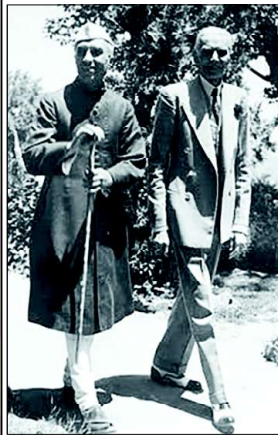
ਜਵਾਹਰ ਲਾਲ ਨਹਿਰੂ ਅਤੇ ਮੁਹੰਮਦ ਅਲੀ ਜਿਨਾਹ

(ਅ). ਕੇਂਦਰੀ ਸਰਕਾਰ ਕੋਲ ਸਿਰਫ ਤਿੰਨ ਮਹਿਕਮੇ-ਰੱਖਿਆ (ਫੌਜਾਂ), ਵਿਦੇਸ਼ੀ ਸਬੰਧ ਅਤੇ ਡਾਕ-ਤਾਰ ਟੈਲੀਫੋਨ ਹੋਣਾ। ਬਾਕੀ ਸਾਰੇ ਮਹਿਕਮੇ ਸੂਬਿਆਂ ਦੇ ਗੁੱਟਾਂ ਕੋਲ ਹੋਣੇ। ਇੱਕ ਕੇਂਦਰੀ ਸੰਵਿਧਾਨ ਘੜਨੀ ਅਸੀਂ ਬਣਾਈ ਜਾਵੇ, ਜੋ ਕੇਂਦਰੀ ਸਰਕਾਰ ਨੂੰ ਚਲਾਉਣ ਬਾਰੇ ਸੰਵਿਧਾਨ ਬਣਾਵੇ। ਕੇਂਦਰੀ ਅਸੈਂਬਲੀ ਵਿੱਚ ਉਪਰੋਕਤ ਤਿੰਨ ਸੂਬਾਈ ਗੁੱਟਾਂ ਦੇ ਨੁਮਾਇੰਦੇ ਵੱਖਰੇ-ਵੱਖਰੇ ਬੈਠ ਕੇ ਆਪੋ-ਆਪਣੇ ਸੂਬਾਈ ਗੁੱਟਾਂ ਦਾ ਸੰਵਿਧਾਨ ਬਣਾਉਣਗੇ। ਭਾਵ ਕੇਂਦਰੀ ਅਸੈਂਬਲੀ ਸਿਰਫ ਕੇਂਦਰ ਦੇ ਤਿੰਨ ਮਹਿਕਮਿਆਂ ਬਾਰੇ ਹੀ ਸੰਵਿਧਾਨ ਬਣਾਵੇਗੀ। ਹਰੇਕ ਸੂਬਾਈ ਗੁੱਟ ਨੂੰ 10 ਸਾਲ ਪਿਛੋਂ ਦਾ ਹੱਕ ਹੋਣਾ ਸੀ। ਇਸ ਮੁਤਾਬਕ ਪਲੈਨ ਵਿੱਚ ਦਰਜ ਸੀ ਕਿ ਇੱਕ ਆਰਜੀ ਸਰਕਾਰ ਕਾਇਮ ਕੀਤੀ ਜਾਵੇਗੀ, ਜਿਸ ਵਿੱਚ ਸਾਰੀਆਂ ਧਿਰਾਂ ਦੇ ਨੁਮਾਇੰਦੇ ਸ਼ਾਮਿਲ ਹੋਣਗੇ।