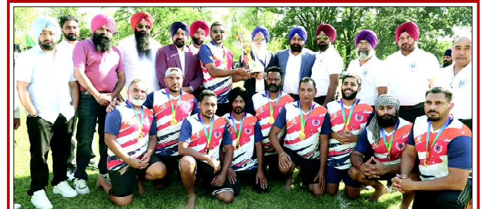
■ ਰੱਸਾਕਸ਼ੀ ‘ਚ ਜੇਤੂ ਚੜ੍ਹਦੀ ਕਲਾ-ਗਰੀਨਫੀਲਡ ਦੀ ਟੀਮ ਦਾ ਸਨਮਾਨ