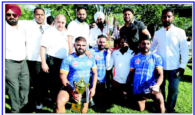
■ ਸ਼ਿਕਾਗੋ ਕਬੱਡੀ ਕੱਪ ਦੀ ਜੇਤੂ ਟੀਮ ਟਰਾਫੀ ਪ੍ਰਾਪਤ ਕਰਦੀ ਹੋਈ

ਕਬੱਡੀ ਦੀ ਕ੍ਰਮੈਂਟੇਟਰੀ ਕਾਲਾ ਰਸੀਨ ਤੇ ਸਵਰਨ ਮੱਲੂ ਬਾਜੇਖਾਨ ਨੇ ਹਲ-ਮਿਲ ਕੇ ਕੀਤੀ। ਕਬੱਡੀ ਦੀ ਤਾਰੀਫ ਵਿੱਚ ਇੱਕ ਕ੍ਰਮੈਂਟੇਟਰ ਨੇ ਸ਼ਿਅਰ ਅਰਜ਼ ਕੀਤਾ: ਵੱਡੇ ਵੱਡੇ ਧਾਵੀਆਂ ਦੇ ਜਿੱਥੇ ਮੂੰਹ ਮੁੜ ਗਏ, ਮਹਿਕ ਸੁੰਘ ਕੇ ਸੋਹਣੇ ਗੁਲਾਬ ਦੀ ਜੀ। ਤੇ ਉਥੋਂ ਦੇ ਲੋਕ ਨੇ ਅਣਖਾਂ ਲਈ ਮਰ ਜਾਂਦੇ, ਕਬੱਡੀ ਖੇਡ ਹੈ ਉਸ ਪੰਜਾਬ ਦੀ ਜੀ। ਪੰਜਾਬੀਆਂ ਦੀ ਦੁਨੀਆਂ ਵਿੱਚ ਜਾਣਿਆ ਜਾਂਦਾ ਹੈ ਤੇ ਇਹ ਖੇਡ ਮੇਲਿਆਂ ਦੀ ਧਰਤੀ ਹੈ। ਕ੍ਰਮੈਂਟੇਟਰਾਂ ਦੇ ਕੁਝ ਬੋਲ ਇਉਂ ਵੀ ਸਨ: -ਮਾਰੀ ਕਬੱਡੀ ਵਿੱਚ ਫਾਲ, ਲਾਇਆ ਜੋਰ ਪੱਟਾਂ ਦੇ ਨਾਲ -ਆਰੀ ਆਰੀ ਆਰੀ, ਗਲ ‘ਚ ਤਵੀਤ ਪਾ ਕੇ ਮੁੰਡਾ ਬਣ ਗਿਆ ਕਬੱਡੀ ਦਾ ਖਿਡਾਰੀ -ਜਿਹਨੂੰ ਸੱਚੇ ਦਿਲੋਂ ਪਿਆਰ ਕਰੀਏ, ਉਹਨੂੰ ਧੋਖੇ