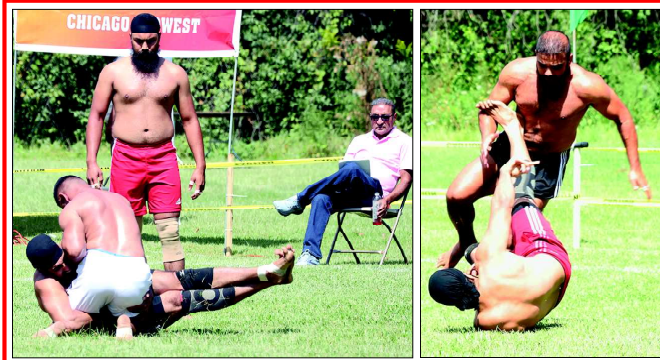
■ ਕਬੱਡੀ ਦੇ ਨਜ਼ਾਰੇ: (1) ਆਹ ਲਾ’ਤਾ ਜਕੜਜੰਦ... (2) ਐਂ ਤਾਂ ਨੂੰ ਮੈਂ ਜਾਣ ਦਿੰਦਾ...

ਖਿਡਾਰੀ ਰੋਡ ਪਾਉਣ ਜਾਂਦਾ ਤਾਂ ਕ੍ਰਮੈਂਟੇਟਰ ਬੋਲਦਾ, ‘ਗੱਭਰੂ ਨੇ ਸੂਟ ਵੱਟੀ ਹੈ’ ਤੇ ‘ਉਡਾਣ ਭਰੀ ਐ’ ਅਤੇ ਧਾਵੀਆਂ ਨੂੰ