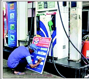
ਪੰਜਾਬ ਵਿੱਚ ਪੈਟਰੋਲ ਅਤੇ ਡੀਜ਼ਲ 'ਤੇ ਵੈਟ ਵਧਾਏ ਜਾਣ ਕਾਰਨ ਪੈਟਰੋਲ ਪੰਪ ਦਾ ਇੱਕ ਕਾਰਿੰਦਾ ਵਧੇ ਰੇਟ ਲਿਖਦਾ ਹੋਇਆ

ਟੈਕਸਾਂ ਦੀ ਗਾਜ਼ ਮੁੜ ਘਿੜ ਕੇ ਸਰਕਾਰੀ ਮੁਲਾਜ਼ਮਾਂ, ਗਰੀਬ ਗੁਰਬਾ ਅਤੇ ਮੱਧ ਵਰਗ 'ਤੇ ਆ ਗਿਰਦੀ ਹੈ। ਦੁਨੀਆਂ ਪੱਧਰ 'ਤੇ ਹੀ ਪੁਲਿਟੀਕਲ ਇਕਾਨਾਮੀ ਦਾ ਅਧਿਅਨ ਕਰਨ ਵਾਲੇ ਵਿਦਵਾਨਾਂ ਅਨੁਸਾਰ ਪਿਛਲੇ ਤਕਰੀਬਨ ਵੀਹ