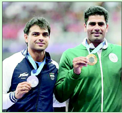
ਜੈਵਲਿਨ ਸੁਟਾਵੇ- ਨੀਰਜ ਚੋਪੜਾ ਤੇ ਅਰਜੁਨ ਨਦੀਮ

ਹਾਕੀ ਤੋਂ ਇਲਾਵਾ ਨੀਰਜ ਚੋਪੜਾ ਨੇ ਜੈਵਲਿਨ ਖਰੋਆ ਵਿੱਚ ਚਾਂਦੀ ਦਾ ਤਮਗਾ ਜਿੱਤਿਆ। ਉਸ ਤੋਂ ਸੋਨੇ ਦੇ ਤਮਗੇ