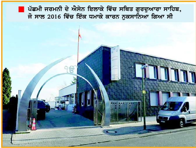
ਪੰਛਮੀ ਜਰਮਨੀ ਦੇ ਐਸੇਨ ਇਲਾਕੇ ਵਿੱਚ ਸਥਿਤ ਗੁਰਦੁਆਰਾ ਸਾਹਿਬ, ਜੋ ਸਾਲ 2016 ਵਿੱਚ ਇੱਕ ਧਮਾਕੇ ਕਾਰਨ ਨੁਕਸਾਨਿਆ ਗਿਆ ਸੀ

ਸੰਨ 2009 ਵਿੱਚ ਜਰਮਨ ਸਰਕਾਰ ਵੱਲੋਂ ਜਾਰੀ ਅੰਕੜਿਆਂ ਅਨੁਸਾਰ ਇੱਥੇ 1,10,204 ਦੇ ਕਰੀਬ ਭਾਰਤੀ