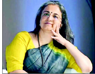
ਮਧਾਬੀ ਪੁਰੀ ਬੁਚ