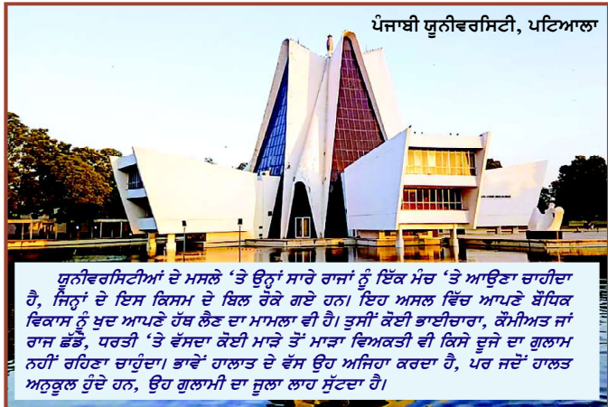
ਪੰਜਾਬੀ ਯੂਨੀਵਰਸਿਟੀ, ਪਟਿਆਲਾ

ਸਾਡੀ ਅਸਲ ਸਮੱਸਿਆ ਦਿਆਨਤਦਾਰ ਮਨੁੱਖ ਪੈਦਾ ਕਰਨ ਦੀ ਹੈ। ਅਸੀਂ ਅਤਿ ਭ੍ਰਿਸ਼ਟ ਸਮਾਜਾਂ ਵਿੱਚੋਂ ਇੱਕ ਹਾਂ। ਇਸ ਦਾ ਵਿਅਕਤੀ ਵੀ ਉਹੋ ਜਿਹਾ ਹੀ ਹੋਵੇਗਾ, ਜਿਹੋ ਜਿਹੇ ਰਾਜ ਕਰਨ ਵਾਲੇ ਹਨ; ਜਾਂ ਜਿਹੋ ਜਿਹੇ ਧਾਰਮਿਕ-ਸਮਾਜਕ ਰੋਲ ਮਾਡਲ ਹਨ। ਇਹ ਵੀ ਹੁੰਦਾ ਕਿ ਜੇ ਸਮਾਜ ਦਾ ਡੀ.ਐਨ.ਏ. ਖਰਾਬ ਹੋਵੇ ਤਾਂ ਰਾਜ ਕਰਨ ਵਾਲੇ ਸਮਾਜ ਨਾਲੋਂ ਵੀ ਬਦ ਹੋ ਜਾਂਦੇ ਹਨ। ਜਦੋਂ ਤੱਕ ਦਿਆਨਤਦਾਰ ਮਨੁੱਖ ਅਸੀਂ ਪੈਦਾ ਨਹੀਂ ਕਰਦੇ, ਕੋਈ ਕੇਂਦਰੀਕਰਨ/ਤਾਨਾਸ਼ਾਹੀ/ਜਮਹੂਰੀਅਤ ਵਿੱਚ ਲੁਕੀ ਤਾਨਾਸ਼ਾਹੀ ਮਸਲੇ ਹੱਲ ਨਹੀਂ ਕਰ ਸਕਦੀ। ਪਹਿਲਾਂ ਰਾਜ ਨੇ ਦਾਣੇ ਦੇਣੇ ਸ਼ੁਰੂ ਕੀਤੇ। ਫਿਰ ਦਾਲਾਂ ਵੀ ਨਾਲ ਆ ਗਈਆਂ। ਹੁਣ ਵਾਲਿਆਂ ਨੇ ਚੱਕੀ 'ਤੇ ਜਾਣ ਦਾ ਵੀ ਜੱਫ ਮਕਾ ਦਿੱਤਾ, ਆਟਾ ਪੀਸਿਆ ਪਿਸਾਇਆ ਮਿਲ੍ਹ; ਦਾਲਾਂ ਦੇ ਬੋਲੇ ਨਾਲ। ਆਉਣ ਵਾਲੀਆਂ ਹਕੂਮਤਾਂ ਕੋਲ ਕੀ ਔਪਸ਼ਨ ਹੈ? ਛੱਡੋ ਸਭ ਕੁਝ, ਪੱਕੀ ਪਕਾਈ ਰੋਟੀ ਘਰ ਆਇਆ ਕਰ। ਟਿਫਨ ਹੀ ਭੇਜ ਦਿਓ ਕਰਾਓ, ਪਰ ਵੋਟ ਸਾਨੂੰ ਪਾਓ। ਰੁਜ਼ਗਾਰ ਨਾ ਭਲਿਓ, ਸਾਰੇ ਟੁੱਕ ਟੋਰ ਹੋ ਜਾਓ। ਛੱਡੋ ਦੋ ਸਾਰੀ ਗੈਰਤ, ਜ਼ਿੰਮੇਵਾਰੀ, ਅਸੀਂ ਸਿਆਸਤਦਾਨ ਜੋ ਰੋਗੇ? ਇਹ ਕਿਧਰ ਨੂੰ ਜਾ ਰਿਹਾ ਹੈ ਸਾਰਾ ਕੁਝ, ਬੰਦੇ ਨੂੰ ਅਪੰਗ ਬਣਾਉਣ ਵੱਲੋਂ?