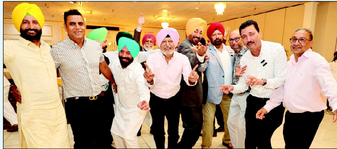
‘ਪੰਜਾਬੀ ਪਰਵਾਜ਼ ਨਾਈਟ’ ਮੌਕੇ ਨੱਚ-ਨੱਚ ਖੁਸ਼ੀ ਮਨਾਉਂਦੇ ਹੋਏ ਮਹਿਮਾਨ

ਅੱਖ ਦੀ ਰਜਮ ਦਾ ਪਛਾਣੇ’ ਅਤੇ ਮਿਹਨਤ ਕਰਨ ਲਈ ਪ੍ਰੇਰਿਤ ਕਰਦਾ ਗੀਤ ‘ਹੁੰਦੀ ਕੀ ਗਰੀਬੀ ਨਖਰੇ, ਅਸੀਂ ਮਾਰ ਕੇ ਚਪੇਤੇ ਘਰੇ ਕੱਚੀ ਐ’ ਪੇਸ਼ ਕੀਤਾ। ਫਿਰ ਉਸ ਨੇ ਪਰਵਾਸੀਆਂ ਦੇ ਦਰਦ ਨੂੰ ਟੋਹਦਾ ਤੇ ਬੜਾ ਹੀ ਭਾਵੁਕ ਕਰ ਦੇਣ ਵਾਲਾ ਗੀਤ ‘ਦਿਲੀ ਏਅਰਪੋਰਟ ਜਹਿਰ ਵਰਗਾ ਉਦੋਂ ਲੱਗਦਾ ਹੋਵੇਗਾ ਮੇਰੀ ਮਾਂ ਨੂੰ’ ਗਾਇਆ।