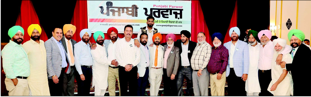
→ ਬਾਕੀ ਅਗਲੇ ਸਫ਼ੇ ਉਤੇ ਪੜ੍ਹੋ