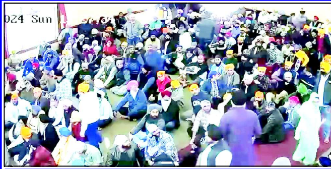
ਗੁਰਦੁਆਰਾ ਸਿਨਸਿਨੈਟੀ ਦੇ ਵਿਸ਼ੇਸ਼ ਇਜਲਾਸ ਵਿੱਚ ਜੁੜੀ ਸੰਗਤ

ਇਸ ਸਭ ਵਰਤਾਰੇ ਵਿੱਚ ਕਿਹੜੀ ਧਿਰ ਸਹੀ ਹੈ ਜਾਂ ਕਿਹੜੀ ਧਿਰ ਸਿਆਸਤ ਖੇਡ ਰਹੀ ਹੈ? ਇਹ ਸਵਾਲ ਪਿੱਛੇ ਰਹਿ ਗਏ ਹਨ, ਪਰ ਜਿਸ ਤਰ੍ਹਾਂ ਗ੍ਰੰਥੀ ਸਿੰਘ ਨਾਲ ਜੁੜਿਆ ਮਾਮਲਾ ਰੰਗ ਫਤ ਗਿਆ ਹੈ, ਉਸ ਨਾਲ ਧੌਰੇਬੰਦਕ ਧਿਰਾਂ ਤੋਂ ਨਿਰਲੇਪ ਸੰਗਤ ਵਿੱਚ ਚਿੰਤਾ ਦਾ ਇੱਕ ਤਰ੍ਹਾਂ ਦਾ ਮਾਹੌਲ ਜ਼ਰੂਰ ਬਣ ਗਿਆ ਹੈ। ਗੁਰਦੁਆਰਿਆਂ ਵਿੱਚ ਧਿਰਾਂ ਦੀਆਂ ਸਿਆਸਤਾਂ ਕੋਈ ਨਵੀਂ ਕਵਾਇਦ ਨਹੀਂ ਹੈ, ਪਰ ਇਸ ਸਭ ਰੋਲ ਘਰੇਲੇ ਵਿੱਚ ਸਿੱਖ ਭਾਈਚਾਰਕ ਸਵਾਂ ਵਿੱਚ ਜਾਂ ਮਾਹੌਲ ਉਸਰ ਰਿਹਾ ਹੈ, ਉਸ ਨੇ ਕੁਝ ਪ੍ਰਤੀਸ਼ਟ ਲੋਕਾਂ ਵਿੱਚ ਗੁਰੂ ਘਰ ਜਾਣ ਸਬੰਧੀ ਕਈ ਤੌਖਲੇ ਵੀ ਖੜੇ ਕੀਤੇ ਹਨ। ਕਈ ਵਾਰ ਤਾਂ ਸਥਿਤੀ ਇਹ ਹੁੰਦੀ ਹੈ ਕਿ ਧਿਰਾਂ ਵੱਲੋਂ ਅਜਿਹਾ ਪ੍ਰਚਾਰਕ ਮਾਹੌਲ ਸਿਰਜਿਆ ਜਾਂਦਾ ਹੈ ਕਿ ਗੁਰਦੁਆਰਿਆਂ ਦੀ ਸਿਆਸਤ ਤੋਂ ਨਿਰਲੇਪ ਸੰਗਤ ਨੂੰ ਸੱਚ-ਝੂਠ ਦਾ ਨਿਤਾਰਾ ਕਰਨਾ ਮੁਸ਼ਕਿਲ ਹੋ ਜਾਂਦਾ ਹੈ।