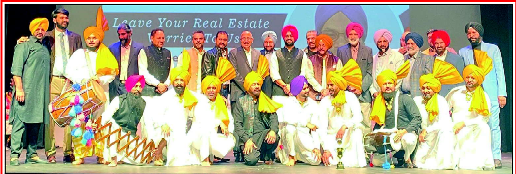
■ 'ਭੰਗੜਾ ਰਾਈਮਜ਼ ਸ਼ਿਕਾਗੋ' ਦੇ ਸਮਾਗਮ ਦੌਰਾਨ ਮਲਵਦੀ ਗਿੱਧਾ ਟੀਮ ਦਾ ਸਨਮਾਨ ਕਰਦੇ ਹੋਏ ਪਤਵੰਤੇ ਸੱਜਣ (ਖਬਰ ਸਫਾ 10 ਉੱਤੇ ਪੜ੍ਹੋ)

ਜਿੱਥੋਂ ਤੱਕ ਹਰਿਆਣਾ ਦਾ ਸਵਾਲ ਹੈ, ਇੱਥੇ ਭਾਜਪਾ ਵੱਲੋਂ ਮੁੱਖ ਮੰਤਰੀ ਬਦਲਣ ਅਤੇ 8 ਕੁ ਮਹੀਨੇ ਦੇ ਸਮੇਂ ਲਈ ਨਵੇਂ ਮੁੱਖ ਮੰਤਰੀ ਨੂੰ ਸਹੁੰ ਚੁੱਕਾਉਣ ਦੇ ਪਿੱਛੇ ਬਹੁਤ ਸਾਰੇ ਮਨਸ਼ੋ ਵੇਖੇ ਜਾ ਰਹੇ ਹਨ। ਯਾਦ ਰਹੇ, ਹਰਿਆਣਾ ਅਸੈਂਬਲੀ ਦੀ ਮਿਆਦ 3 ਨਵੰਬਰ 2024 ਨੂੰ ਖਤਮ ਹੋ ਰਹੀ ਹੈ। ਨਾਇਬ ਸੈਣੀ ਹਰਿਆਣਾ ਭਾਜਪਾ ਦੇ ਮੁਖੀ ਹਨ ਅਤੇ ਕੁਰਕਸ਼ੇਤਰ ਤੋਂ ਮੈਂਬਰ ਪਾਰਲੀਮੈਂਟ ਹਨ। ਇੰਜ ਉਹ ਹਰਿਆਣਾ ਅਸੈਂਬਲੀ ਦੇ ਹਾਲ ਦੀ ਘੜੀ ਮੈਂਬਰ ਨਹੀਂ ਹਨ। ਇਸ ਲਈ ਛੇ ਮਹੀਨੇ ਤੋਂ ਵੱਧ ਮੁੱਖ ਮੰਤਰੀ ਨਹੀਂ ਰਹਿ ਸਕਦੇ। ਕਾਨੂੰਨ ਦੀ ਕਿਤਾਬ ਅਨੁਸਾਰ, ਛੇ ਮਹੀਨੇ ਦੇ ਸਮੇਂ ਦੇ ਅੰਦਰ-ਅੰਦਰ ਉਨ੍ਹਾਂ ਦਾ ਅਸੈਂਬਲੀ ਮੈਂਬਰ ਵਜੋਂ ਚੁਣੇ ਜਾਣਾ ਲਾਜ਼ਮੀ ਹੋਵੇਗਾ। ਉਨ੍ਹਾਂ ਦੀ ਮੁੱਖ ਮੰਤਰੀ ਵਜੋਂ ਟਰਮ 12 ਸਤੰਬਰ ਨੂੰ ਖਤਮ ਹੋ ਜਾਵੇਗੀ। ਇਸ ਤਰ੍ਹਾਂ ਇੱਕ ਦੋ ਮਹੀਨੇ ਲਈ ਅਸੈਂਬਲੀ ਚੋਣ ਲੜਨ ਦੀ ਤੇ ਕੋਈ ਤੁਕ ਨਹੀਂ ਬਣਦੀ। ਸੋ ਭਾਜਪਾ ਵੱਲੋਂ ਫੈਸਲਾ ਕਰ ਲਿਆ ਗਿਆ ਲਗਦਾ ਹੈ ਕਿ ਮੌਜੂਦਾ ਹਰਿਆਣਾ ਅਸੈਂਬਲੀ 12 ਸਤੰਬਰ ਤੱਕ ਹੀ ਚੱਲੇਗੀ। ਸੋ ਛੇ ਕੁ ਮਹੀਨੇ ਲਈ ਮੁੱਖ ਮੰਤਰੀ ਬਦਲਣ ਦੀ ਮਜ਼ਬੂਰੀ ਕਈ ਚੋਣ ਨਿਸ਼ਾਨਿਆਂ ਨੂੰ ਵਿਨੁੱਟ ਦਾ ਯਤਨ ਹੈ। ਸਭ ਤੋਂ ਵੱਡੀ ਗੱਲ ਇਹ ਕਿ ਹਰਿਆਣਾ-ਪੰਜਾਬ ਦੇ