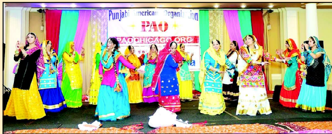
ਪਿਛਲੇ ਸਾਲ ਦੇ ਤੀਆਂ ਦੇ ਮੇਲੇ ਦੀ ਇੱਕ ਝਲਕ