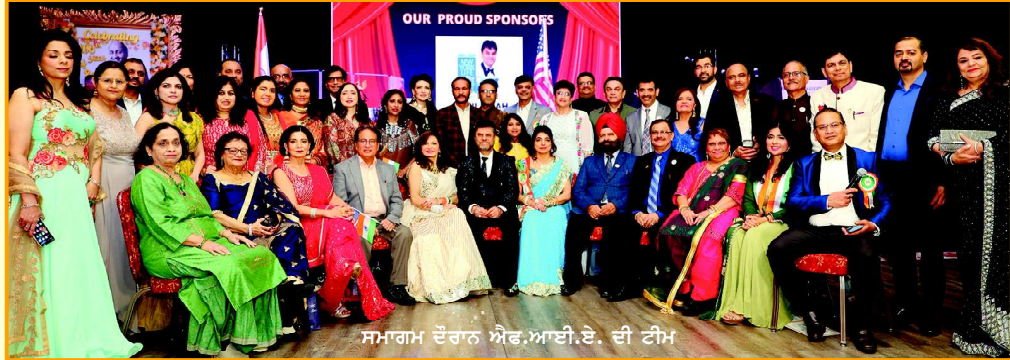
ਸਮਾਗਮ ਦੌਰਾਨ ਐੱਫ.ਆਈ.ਏ. ਦੀ ਟੀਮ