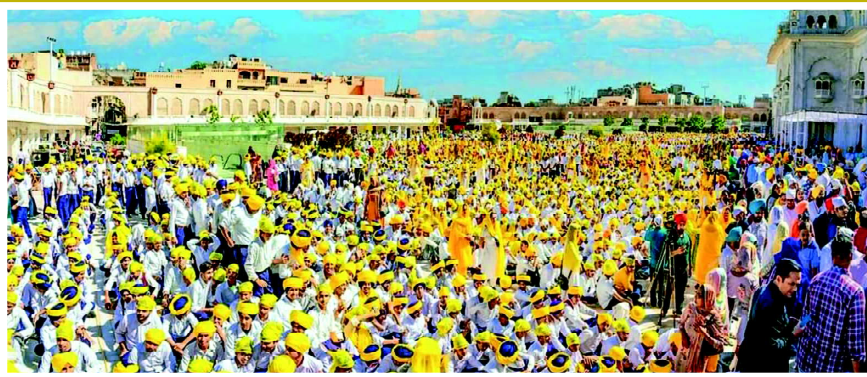
■ ਹਰਿਮੰਦਰ ਸਾਹਿਬ ਵਿਖੇ ਨਸ਼ਾ ਵਿਰੋਧੀ 'ਦਾ ਹੋਪ ਇਨੀਸ਼ੀਏਟਿਵ' ਦੀ ਸ਼ੁਰੂਆਤ ਮੌਕੇ

'ਦਾ ਹੋਪ ਇਨੀਸ਼ੀਏਟਿਵ' ਸਰਕਾਰ ਦਾ ਹਾਂਮੁਖੀ ਪ੍ਰਭਾਵ ਕਾਇਮ ਰੱਖਣ ਦਾ ਯਤਨ