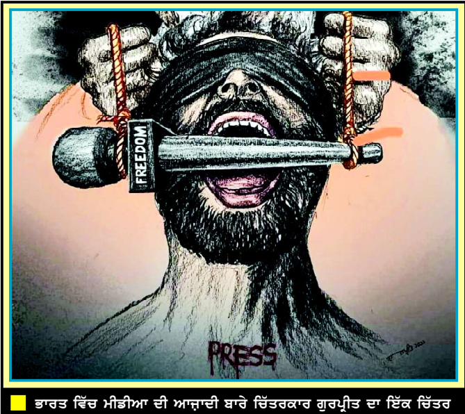
ਭਾਰਤ ਵਿੱਚ ਮੀਡੀਆ ਦੀ ਆਜ਼ਾਦੀ ਬਾਰੇ ਚਿੱਤਰਕਾਰ ਗੁਰਪ੍ਰੀਤ ਦਾ ਇੱਕ ਚਿੱਤਰ

ਪੇਸ਼ੇਵਰ, ਤੰਦਰੁਸਤੀ ਅਤੇ ਕੰਮਕਾਰ ਦੀ ਆਰਥਿਕਤਾ ਦੇ ਖੇਤਰ ਵਿੱਚ ਰਿਪੋਰਟ ਅਨੁਸਾਰ 66% ਮਰਦਾਂ ਦੇ ਮੁਕਾਬਲੇ 85% ਔਰਤਾਂ ਦੇ ਨੌਕਰੀ ਦੇ ਨਤੀਜੇ ਵਜੋਂ ਉਨ੍ਹਾਂ ਦੀ ਮਾਨਸਿਕ ਸਿਹਤ ਉੱਤੇ ਪ੍ਰਭਾਵ ਦੀ ਰਿਪੋਰਟ ਕੀਤੀ ਹੈ। ਅੰਗਰੇਜ਼ੀ ਸਮਾਚਾਰ ਸੰਗਠਨਾਂ