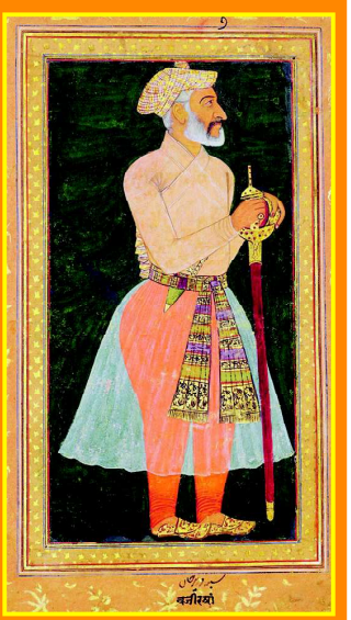
ਵਜ਼ੀਰ ਖਾਨ ਦਾ ਇੱਕ ਚਿੱਤਰ

ਸਾਹਿਬ ਪੜ੍ਹੇ ਜਾਣ ਦੀ ਆਵਾਜ਼ ਪਈ ਤਾਂ ਵਜ਼ੀਰ ਖਾਨ ਨੂੰ ਐਸਾ ਆਨੰਦ ਆਇਆ ਕਿ ਉਹ ਲੰਘਿਆ ਜਾਂਦਾ ਸੁਣਨ ਲਈ ਮੁੜ ਪਿਆ। ਉਸ ਦੇ ਮਨ ‘ਤੇ ਸੁਖਮਨੀ ਸਾਹਿਬ ਦਾ ਏਨਾ ਅਸਰ ਹੋਇਆ ਕਿ ਉਹ ਸੁਖਮਨੀ ਸਾਹਿਬ ਸੁਣੇ ਬਿਨਾ ਪ੍ਰਸਾਦ ਮੂੰਹ ‘ਚ ਨਹੀਂ ਪਾਉਂਦਾ ਸੀ। ਵਜ਼ੀਰ ਆਪਣੇ ਆਪ ਨੂੰ ਗੁਰੂ ਦਾ ਖਾਦਮ ਕਹਿੰਦਾ ਹੁੰਦਾ ਸੀ। ਆਪ ਉਹ ਭਾਵੇਂ ਪ੍ਰਸਿੱਧ ਹਕੀਮ ਸੀ, ਪਰ ਜਲੋਪਦ ਦੀ ਬਿਮਾਰੀ ਨੇ ਐਸਾ ਗੁੱਸਿਆ ਕਿ ਸਾਰੇ ਉਪਰਾਲੇ ਅਸਫਲ ਸਿੱਧ ਹੋਏ। ਵਜ਼ੀਰ ਖਾਨ ਨੂੰ ਪਾਲਕੀ ਵਿੱਚ ਬਿਠਾ ਕੇ ਅੰਮ੍ਰਿਤਸਰ ਲਿਆਂਦਾ ਗਿਆ। ਗੁਰੂ ਅਰਜਨ ਦੇਵ ਜੀ ਉਸ ਸਮੇਂ ਦੁੱਖ ਭੰਜਨੀ ਬੇਰੀ ਪਾਸ ਥੜ੍ਹੇ ਉਪਰ ਬੈਠ ਕੇ ਅੰਮ੍ਰਿਤ ਸਰੋਵਰ ਦੀ ਗਾਰ ਕਵਾ ਰਹੇ ਸਨ।