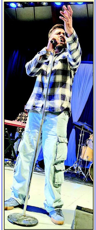
ਪੰਜਾਬੀ ਕਮਿਊਨਿਟੀ ਆਰਗੇਨਾਈਜ਼ੇਸ਼ਨ (ਪੀ.ਸੀ.ਓ.) ਮਿਲਵਾਕੀ ਵੱਲੋਂ ਕਰਵਾਏ ਗਏ ਸ਼ੋਅ ਦੌਰਾਨ ਗਾਇਕ ਨਿੰਜਾ ਸੁਰ ਲਾਉਂਦਾ ਹੋਇਆ।