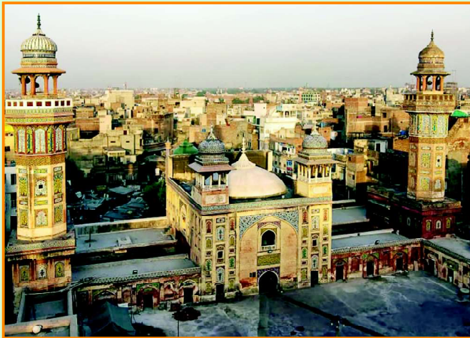
ਵਜ਼ੀਰ ਖਾਨ ਵੱਲੋਂ ਲਾਹੌਰ, ਪਾਕਿਸਤਾਨ ਵਿੱਚ ਬਣਾਈ ਗਈ ਮਸੀਤ