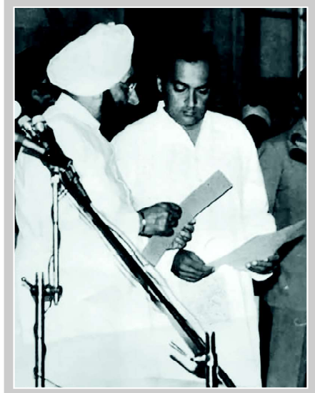
ਗਿਆਨੀ ਜੈਲ ਸਿੰਘ ਦੀ ਮੌਜੂਦਗੀ ਵਿੱਚ ਪ੍ਰਧਾਨ ਮੰਤਰੀ ਵਜੋਂ ਸਹੂ ਚੁੱਕਦੇ ਹੋਏ ਰਾਜੀਵ ਗਾਂਧੀ

ਰਾਸ਼ਟਰਪਤੀ ਨੇ ਆਪਣੇ ਸਕੱਤਰ ਨੂੰ ਜਹਾਜ਼ ਵਿੱਚੋਂ ਹੀ ਰਾਜੀਵ ਗਾਂਧੀ ਨਾਲ ਗੱਲ ਕਰਵਾਉਣ ਲਈ ਕਿਹਾ। ਸਕੱਤਰ ਨੇ ਸਲਾਹ ਦਿੱਤੀ ਕਿ ਜਹਾਜ਼ ਵਿੱਚੋਂ ਰੇਡੀਓ ਟਰਾਂਸਮਿਸ਼ਨ 'ਤੇ ਗੱਲ ਕਰਨੀ ਠੀਕ ਨਹੀਂ, ਕਿਉਂਕਿ ਗੱਲ ਪਾਕਿਸਤਾਨ ਵਿੱਚ ਲੀਕ ਹੋ ਸਕਦੀ ਹੈ। ਗਿਆਨੀ ਜੈਲ ਸਿੰਘ ਦਿੱਲੀ ਏਅਰਪੋਰਟ ਤੋਂ ਸਿੱਧੇ ਆਲ ਇੰਡੀਆ ਸੈਡੀਕਲ ਇੰਸਟੀਚਿਊਟ ਵਿੱਚ ਗਏ, ਜਿੱਥੇ ਇੰਦਰਾ ਗਾਂਧੀ ਦੀ ਮ੍ਰਿਤਕ ਦੇਹ ਪਈ ਸੀ। ਰਸਤੇ ਵਿੱਚ ਅਤੇ ਆਲ ਇੰਡੀਆ ਇੰਸਟੀਚਿਊਟ ਵਿੱਚ ਰਾਸ਼ਟਰਪਤੀ ਦੇ ਕਾਫ਼ਲੇ 'ਤੇ ਹਮਲਾ ਵੀ ਹੋਇਆ ਸੀ। ਆਲ ਇੰਡੀਆ ਇੰਸਟੀਚਿਊਟ ਵਿੱਚ ਜਦੋਂ ਗਿਆਨੀ ਜੈਲ ਸਿੰਘ ਪਹੁੰਚੇ ਤਾਂ ਰਾਜੀਵ ਗਾਂਧੀ ਉਥੇ ਮੌਜੂਦ ਸਨ। ਗਿਆਨੀ ਜੈਲ ਸਿੰਘ ਨੇ ਰਾਜੀਵ ਗਾਂਧੀ ਦੇ ਮੌਢੇ 'ਤੇ ਹੱਥ ਰੱਖਿਆ ਅਤੇ ਅਫਸੋਸ ਕਰਨ ਤੋਂ ਬਾਅਦ ਉਨ੍ਹਾਂ ਨੂੰ ਰਾਸ਼ਟਰਪਤੀ ਭਵਨ ਆ ਕੇ ਪ੍ਰਧਾਨ ਮੰਤਰੀ ਦੀ ਸਹੂ ਚੁੱਕਣ ਲਈ ਕਿਹਾ। ਪ੍ਰੋਟੋਕੋਲ ਅਤੇ ਸਥਾਪਤ ਪਰੰਪਰਾਵਾਂ ਅਨੁਸਾਰ ਜਿਵੇਂ ਪਹਿਲਾਂ 1964 ਵਿੱਚ ਪੰਡਿਤ ਜਵਾਹਰ ਲਾਲ ਨਹਿਰੂ ਅਤੇ 1966 ਵਿੱਚ ਲਾਲ ਬਹਾਦਰ ਸ਼ਾਸਤਰੀ ਦੀਆਂ ਮੌਤਾਂ ਤੋਂ ਬਾਅਦ ਉਨ੍ਹਾਂ ਦੇ ਮੰਤਰੀ ਮੰਡਲ ਦੇ ਸਭ ਤੋਂ ਸੀਨੀਅਰ ਮੰਤਰੀ ਗੁਲਜ਼ਾਰੀ ਲਾਲ ਨੰਦਾ ਨੂੰ ਕੌਮ ਚਲਾਉ ਪ੍ਰਧਾਨ ਮੰਤਰੀ ਦੀ ਸਹੂ ਚੁਕਵਾਈ ਗਈ ਸੀ। ਉਸੇ ਤਰ੍ਹਾਂ ਇੰਦਰਾ ਗਾਂਧੀ ਦੇ ਮੰਤਰੀ ਮੰਡਲ ਵਿੱਚ ਸਭ ਤੋਂ ਸੀਨੀਅਰ ਮੰਤਰੀ ਪ੍ਰਣਾਬ ਮੁਕਰਜੀ ਸਨ। ਇਸ ਲਈ ਉਨ੍ਹਾਂ ਨੂੰ ਸਹੂ ਚੁਕਾਉਣੀ ਬਣਦੀ ਸੀ, ਪੰਤੂ ਗਿਆਨੀ ਜੈਲ ਸਿੰਘ ਨੇ ਰਾਜੀਵ ਗਾਂਧੀ ਨੂੰ ਸਹੂ ਚੁਕਾ ਦਿੱਤੀ ਸੀ।