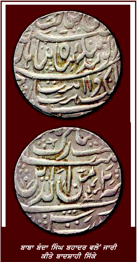
ਬਾਬਾ ਬੰਦਾ ਸਿੰਘ ਬਹਾਦਰ ਵਲੋਂ ਜਾਰੀ ਕੀਤੇ ਬਾਦਸ਼ਾਹੀ ਸਿੱਕੇ

'ਸਿੱਕਾ ਜਦ ਬਰ ਹਰ ਦੇ ਆਲਮ ਤੇਗਿ ਨਾਨਕ ਵਾਗਿਬ ਅਸਤ' 'ਫਤਹਿ ਗੋਬਿੰਦ ਸਿੰਘ ਸਾਹਿ-ਸ਼ਾਹਾਨ ਫਜ਼ਲਿ ਸੱਚਾ ਸਾਹਿਬ ਅਸਤ' ਜਿਸਦਾ ਅਰਥ ਹੈ: ਸਿੱਕਾ ਮਾਰਿਆਂ ਦੇ ਜਹਾਨ ਉੱਤੇ, ਬਖਸ਼ਾਂ ਬਖਸ਼ੀਆਂ ਨਾਨਕ ਦੀ ਤੇਗ ਨੇ ਜੀ।